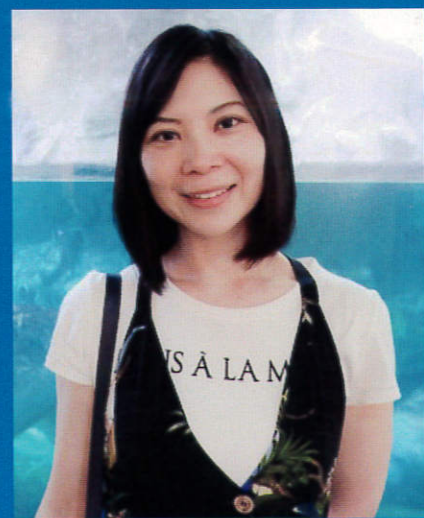
講師プロフィール